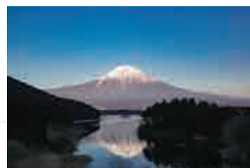
一度は見たい! 田貫湖からの富士山